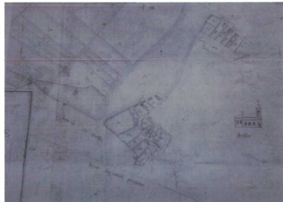
Représentation de l'église de Fressies sur un plan de 1785 (Plan Cambrai2).

Il convenait également de redonner une maison au prêtre. Cependant, les mauvaises récoltes de 1768-1769 et les inondations en 1770 grèvent tellement la population que le mayeur se vit dans l'obligation de faire appel à « la charité » des chanoines de Saint-Géry pour la financer.